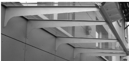
<.....> Fr. 1800.--/m 2