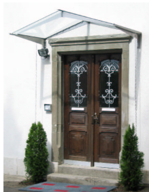
<.....> Fr. 2450.--/m 2