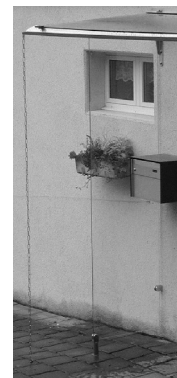
<.....> Fr. 950.--/m 2